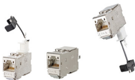
EREGplus-M90 EREGplus-M180 EREGplus-M270