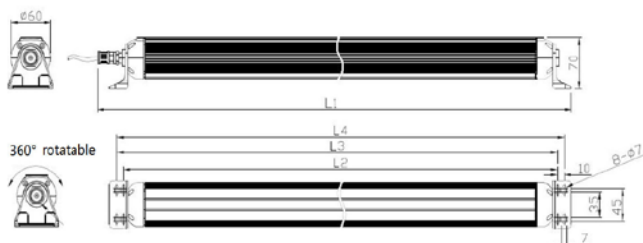
rozměry M9R (mm)