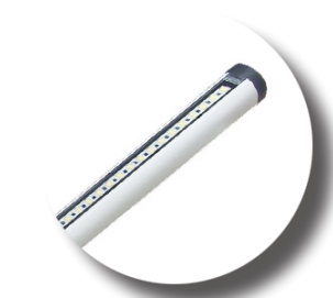
Super tenké hliníkové tělo