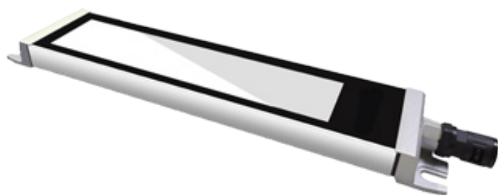
Ultratenké hliníkové tělo