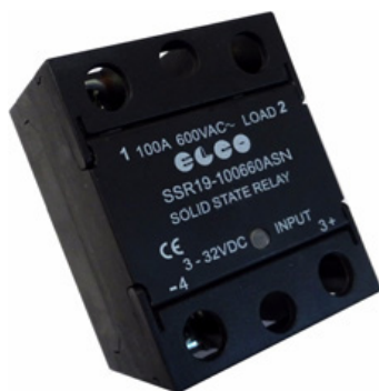
SSR19 - 80/100/125 A